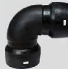
Ø180 Ø200 Ø225